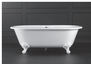
Bath shown with optional K50 waste kit