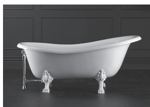
Bath shown with optional K50 waste kit